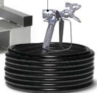
Graco XM Plural-Component Sprayer (标准配置)